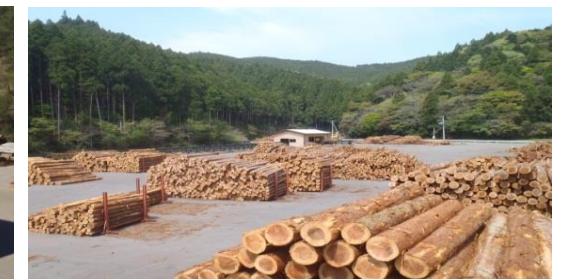
香美森林組合繁藤ストックヤード