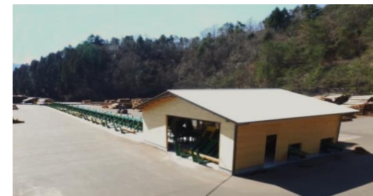
津野町森林組合朝見谷ストックヤード