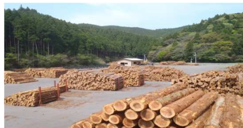
香美森林組合繁藤ストックヤード