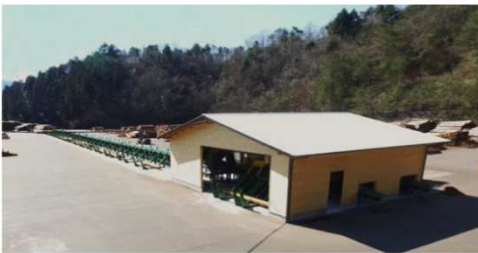
津野町森林組合朝見谷ストックヤード